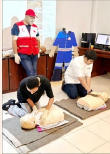
■ Participants perform CPR on a mannequin under the guidance of an expert

The programme aims to enable children to deliver first aid before a paramedic arrives to tackle emergencies.